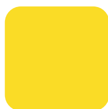
ZONNIG GEEL (2)