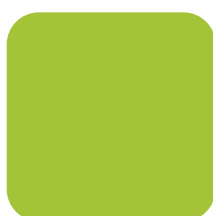
LIMEGROEN (36) RAL 6033